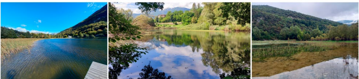
Figura 3. Siti di presenza di gamberi alieni invasivi in Trentino. Da sinistra a destra: Lago di Lagolo, Lago Costa, Lago di Terlago.

lato per la prima volta nel Lago di Lagolo, nel bacino del fiume Sarca, nel 2013 da guardiapesca dell'Associazione Pescatori Basso Sarca; nel 2014 un monitoraggio effettuato con census visuale e nasse (Cappelletti e Ciutti, 2016) ha confermato la presenza di P. clarkii a Lagolo e la scomparsa di A. pallipes , segnalato nel lago fino all'anno 2012 (Cappelletti e Ciutti, 2016). La popolazione di gambero rosso della Louisiana di Lagolo, da indagini sanitarie effettuate nel 2022, risulta infatti portatrice sana della peste del gambero, malattia che ha presumibilmente sterminato il gambero di fiume che popolava le acque del lago. I ricercatori della Fondazione Mach stanno conducendo dal 2020 campagne annuali di rimozione. Il gambero della Louisiana è stato successivamente segnalato dal 2019 in Alto Adige nei fossi agricoli da Egna fino a Caldaro, con rischio di ingresso in Trentino da Nord.