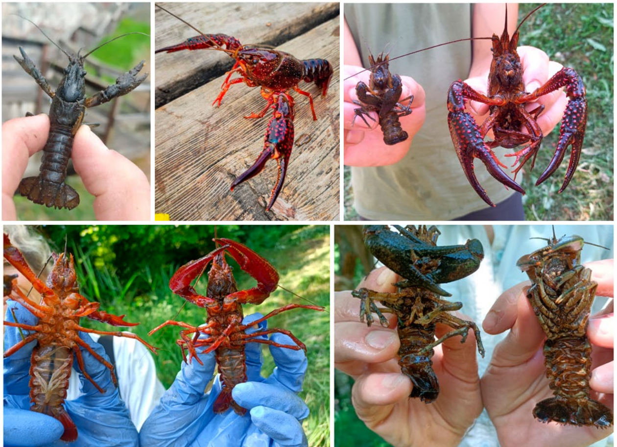
Figura 1. Dall'alto in basso, in senso orario: esemplare maschio di gambero americano; esemplare maschio di gambero rosso della Louisiana; confronto taglia tra maschi di gambero americano e gambero rosso della Louisiana; maschio (sin.) e femmina (des.) di gambero americano; femmina (sin.) e maschio (des.) di gambero rosso della Louisiana (esemplari catturati al Lago Costa).

numero di uova 4-6 volte maggiore di quello di A. pallipes , sono portatrici sane, e quindi vettrici, della peste del gambero. Come vedremo, la distribuzione di queste due specie, almeno in Trentino, è relativamente contenuta, ma sussiste il rischio che possano venire traslocate in altri corpi idrici. Tale evento va assolutamente evitato, ai fini della conservazione dei popolamenti residui dell'autoctono gambero di fiume. Inoltre, Procambarus clarkii è la causa, ormai ampiamente documentata, della perdita di biodiversità nei corpi idrici che invade: la sua attività di predazione provoca l'estinzione locale di numerose specie di molluschi, pesci, anfibi,