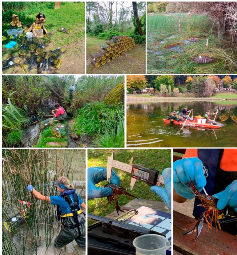
Figura 4. Attività di cattura e rilievo durante le campagne di rimozione. Dall'alto in basso, da sinistra a destra: Preparazione e messa in opera delle nasse, recupero delle nasse, misura della lunghezza del cefalotorace, prelievo di tampone cuticolare per indagini sanitarie.

bero americano, hanno inaspettatamente catturato anche numerosi esemplari di gambero rosso della Louisiana, incluse alcune femmine che portavano sull'addome uova e larve, cioè i nuovi nati appena usciti dalle uova. L'origine e la modalità di introduzione di questo secondo gambero alieno invasivo nel Lago Costa sono ignote, ma si può presupporre un'introduzione volontaria poiché in un monitoraggio condotto in ottobre 2022, il gambero rosso della Louisiana non risultava presente né nel lago Costa, né nel Rio Valguarda. Questo rinvenimento rappresenta quindi la seconda popolazione di Procambarus clarkii del Trentino e costituisce una importante minaccia per le popolazioni di Austropotamobius pallipes