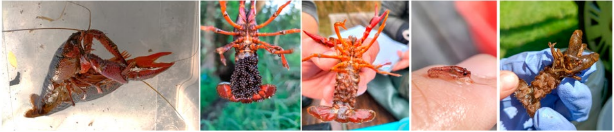
Figura 2. Ciclo vitale delle specie aliene invasive. Da sinistra a destra: Procamburus clarkii , accoppiamento, femmina con uova, femmina con giovanili al primo stadio, giovanile. Faxonius limosus , femmina con giovanili al primo stadio.

idrofite e macroinvertebrati, oltre a quella già citata delle popolazioni di gamberi autoctoni europei.