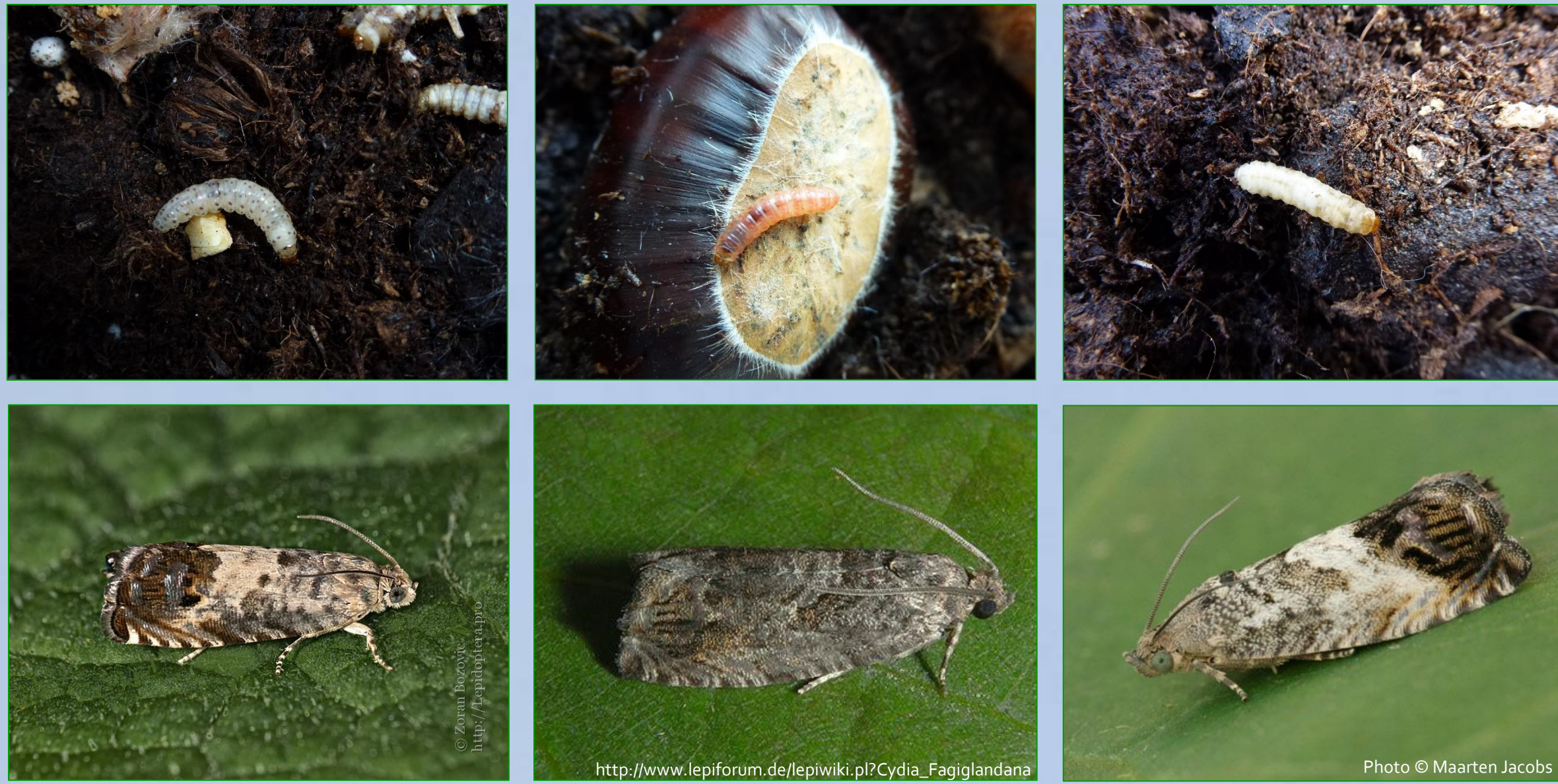
Pammene fasciana : larva e adulto

Dipartimento Innovazione nelle Produzioni Vegetali, Centro Trasferimento Tecnologico, Fondazione Edmund Mach, 38010 San Michele all'Adige, Italia